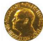
Premio Nobel de la Paz compartido, 1997