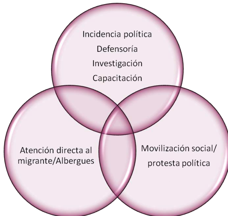
Imagen 1. Funciones de las OSC en ámbito migratorio en la CDMX